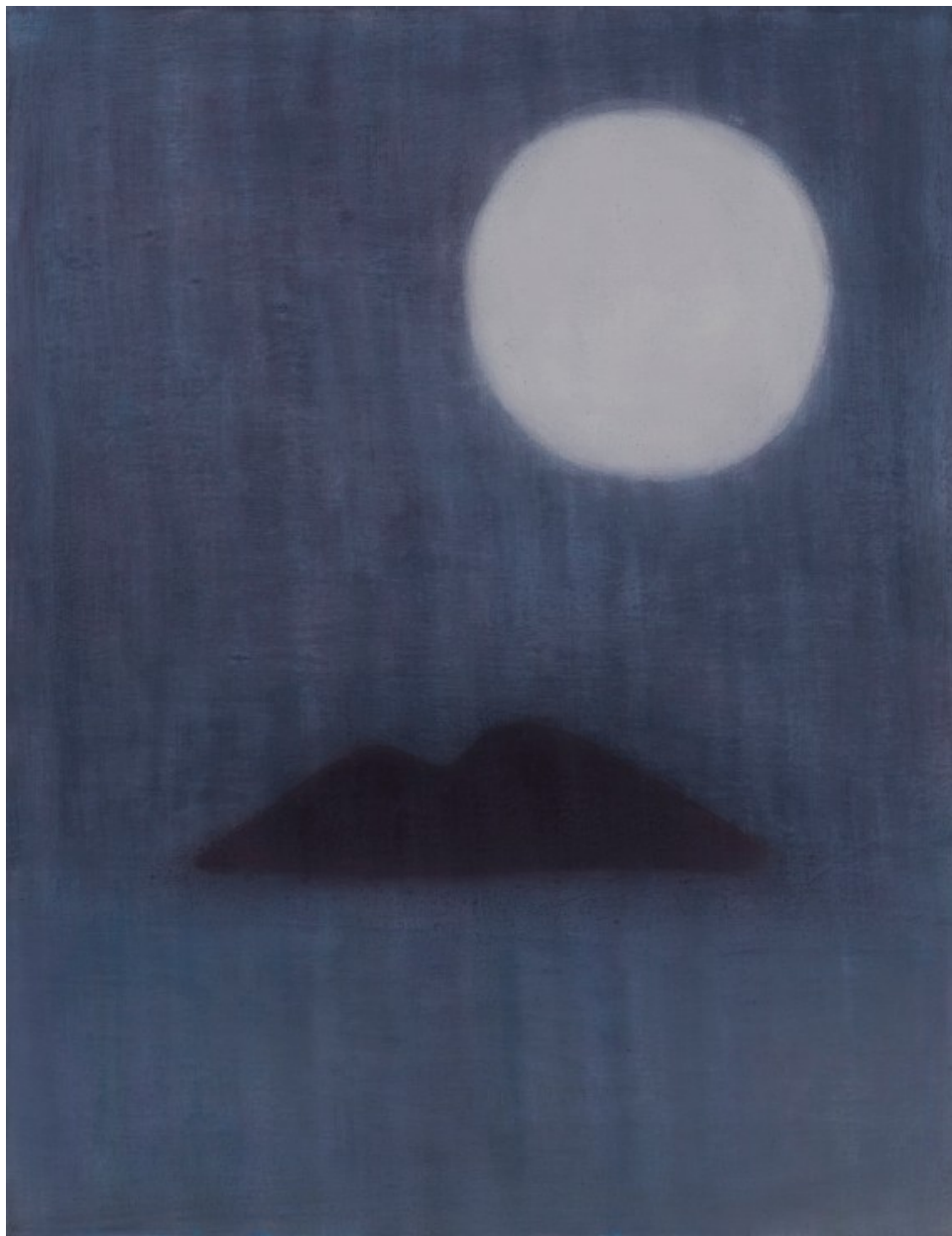
MARIANNITA LUZZATI SEM TÍTULO, óleo sobre tela 85 x 66 cm