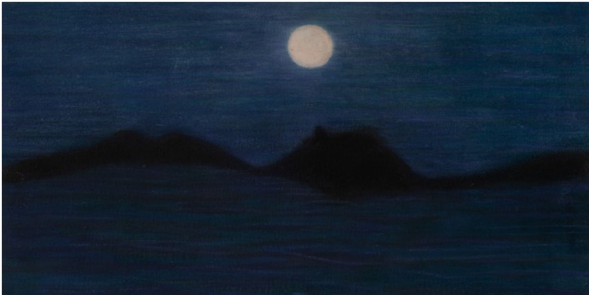
MARIANNITA LUZZATI SEM TÍTULO, 2021 óleo sobre tela 25 x 50 cm