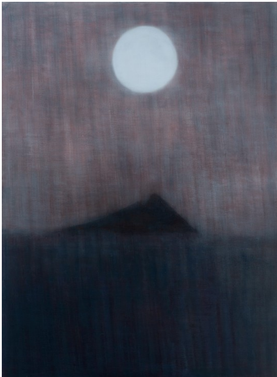
MARIANNITA LUZZATI SEM TÍTULO, 2019 óleo sobre tela 167 x 120 cm