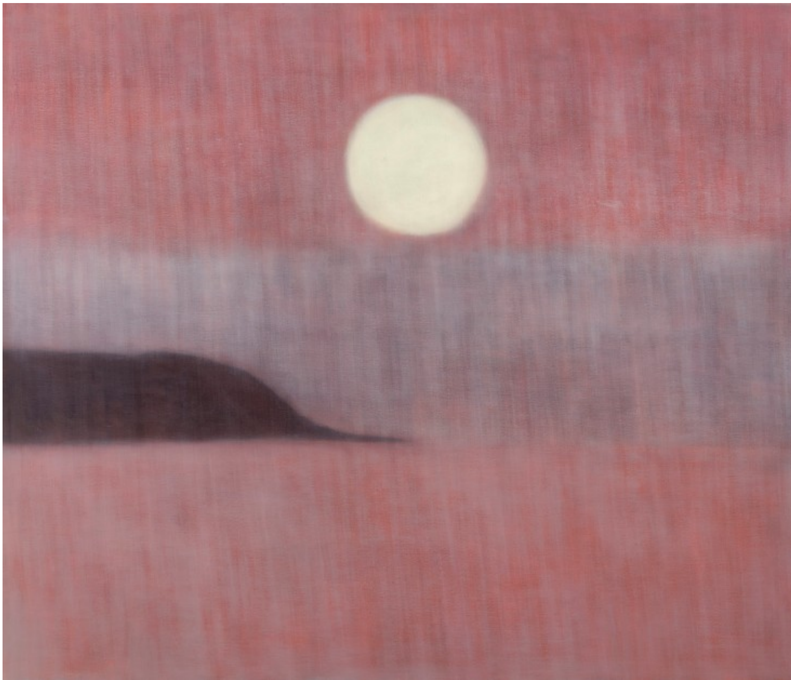
MARIANNITA LUZZATI SEM TÍTULO, 2020 óleo sobre tela 171 x 200 cm