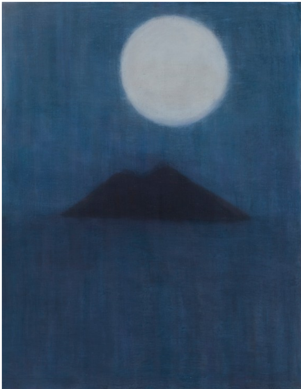
MARIANNITA LUZZATI SEM TÍTULO, 2020 óleo sobre tela 84 x 64 cm