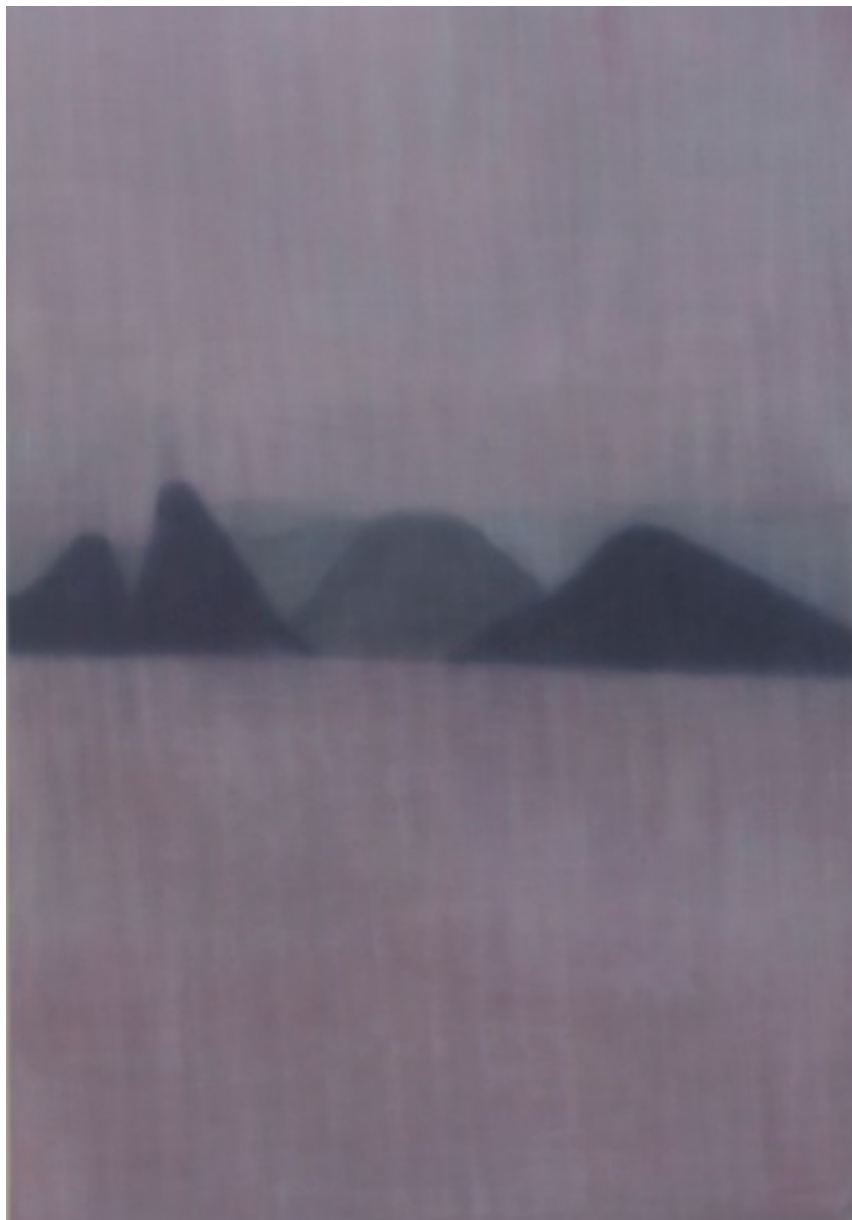
MARIANNITA LUZZATI PINK VIEW, SD óleo sobre tela 150 x 100 cm