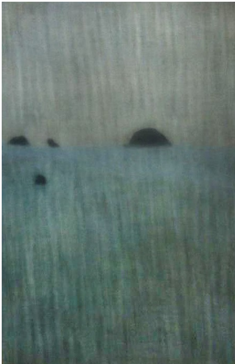
MARIANNITA LUZZATI SEM TÍTULO, 2016 óleo sobre tela 170 x 110 cm